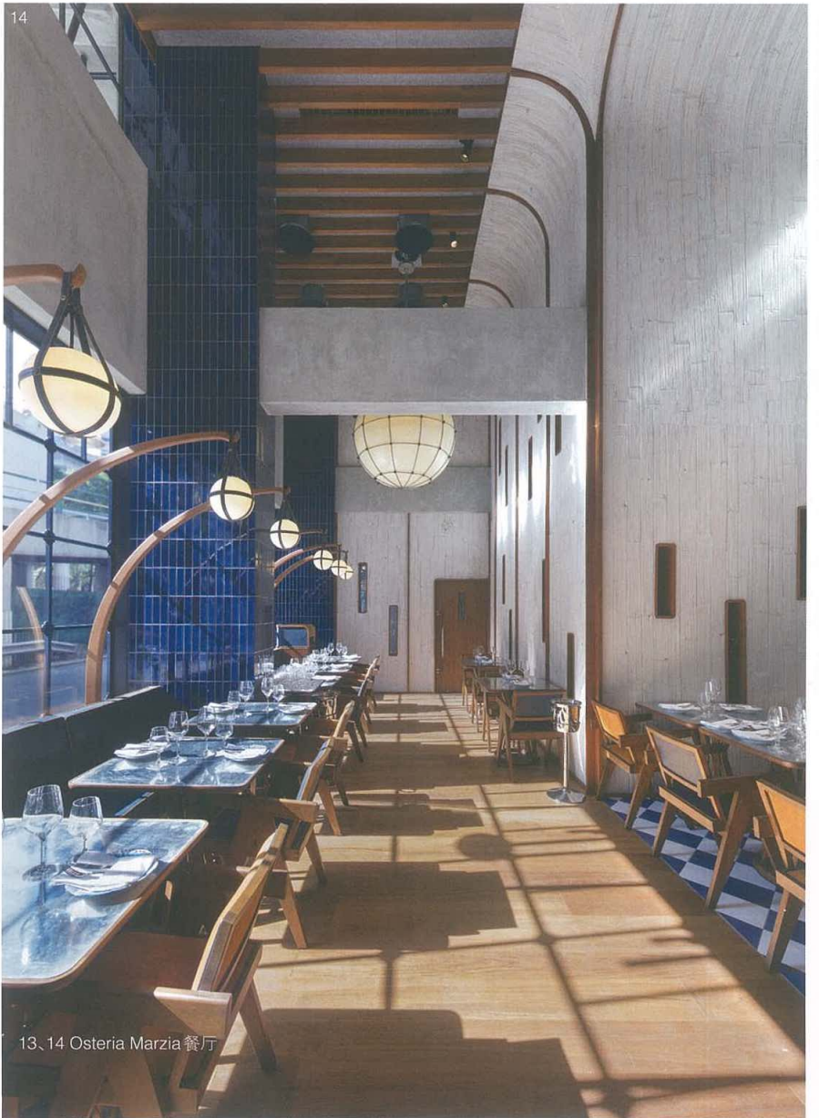
13、14 Osteria Marzia 餐厅