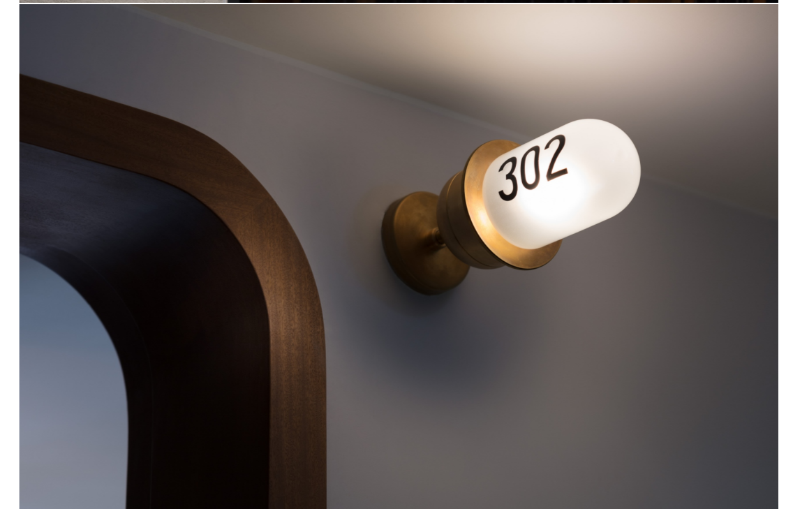
左上图_电梯 左下图_过道 右二图_黄铜材质的灯具细节